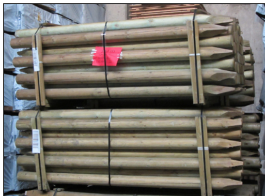
Mynd 3. Stæða af gagnvörðum staurum