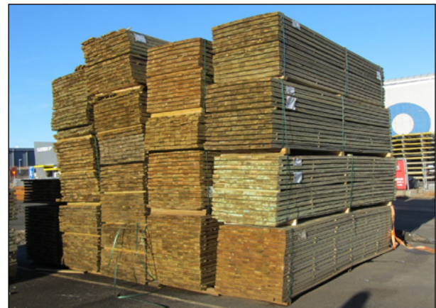
Mynd 2. Stæða af gagnvörðu efni