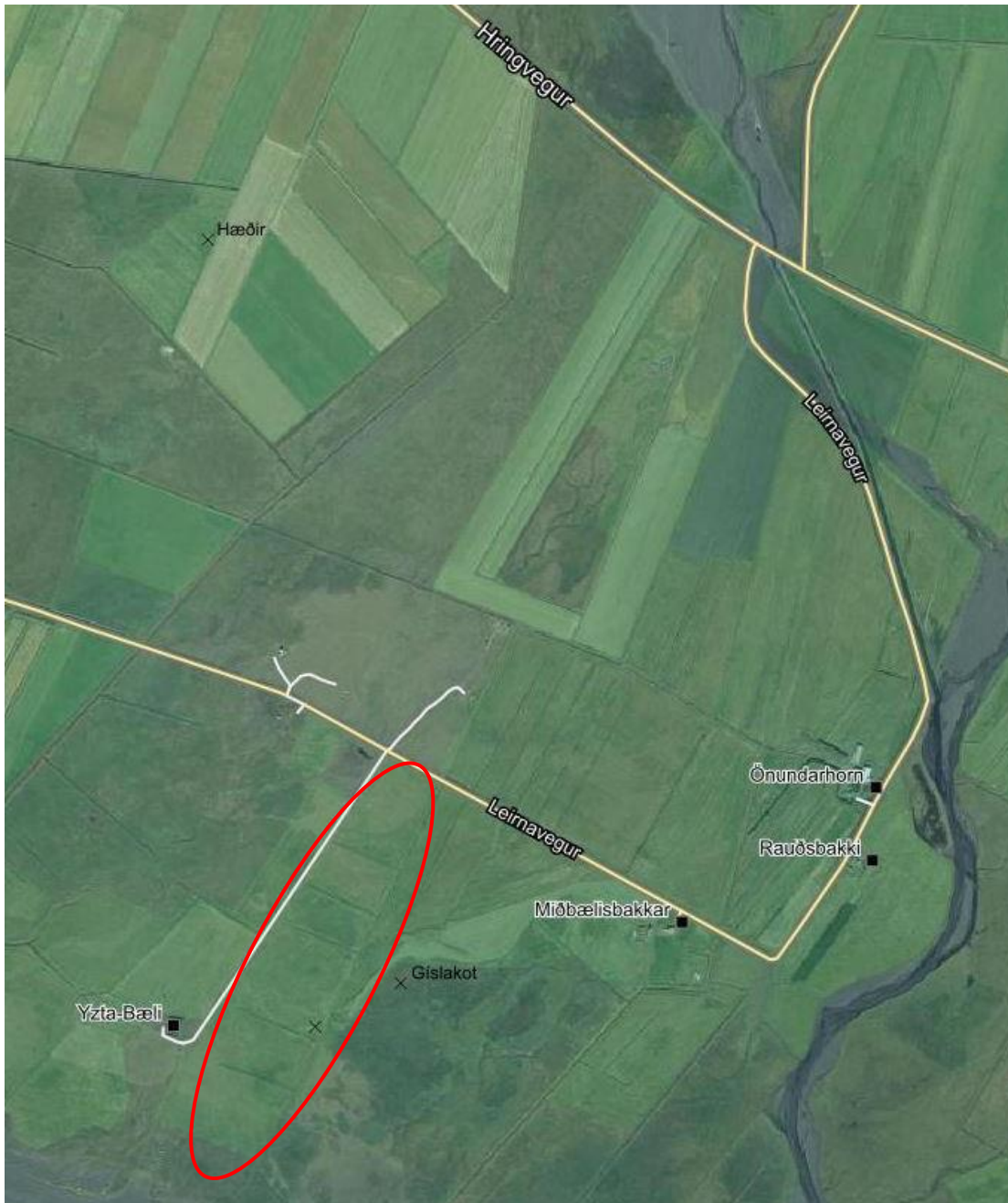
MYND 1. Skipulagssvæðið er innan rauða hringsins. Heimild: map.is.

Deiliskipulagssvæðið tekur til um 20 ha svæðis. Aðkoma er af Suðurlandsvegi undir Eyjafjöllum, við brú yfir Svaðbælisá, um Leirnaveg nr. 243 og um núverandi veg að Yzta-Bæli. Hver íbúðarlóð fær sér aðkomu frá vegi að Yzta-Bæli. Landið er flatt og í flokki I skv. flokkun landbúnaðarlands. Landið hefur verið framræst og var áður nýtt til landbúnaðar. Samkvæmt vistgerðarflokkun Náttúrufræðistofnunar er svæðið skilgreint sem tún og akurlendi.