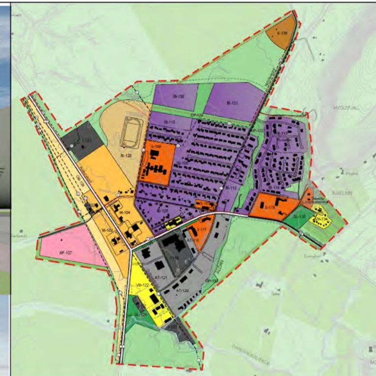
ADALSKIPULAG - HVOLSVÖLLUR, RANGÁRÞING EYSTRI