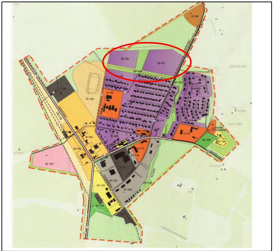
Skipulagsuppráttur Aðalskipulag Rangárþings eystra 2012-2024, Hvolsvöllur. Skipulagssvæðið markað rauðum hring.

Skipulagslýsing þessi var samþykkt í skipulagsnefnd: _____ þann _____ 2019 Sveitarstjórn: _____ þann _____ 2019 Tillagan var auglýst frá _____ 2019 Með athugasemdafresti til _____ 2019