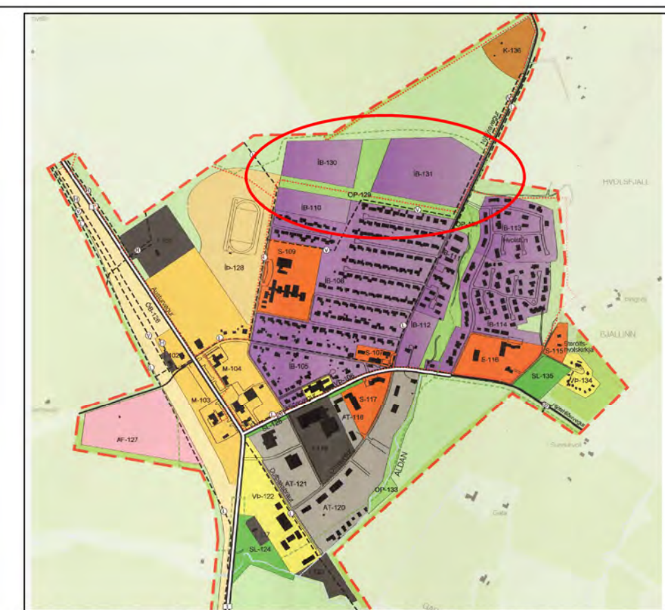
Skipulagsuppráttur Aðalskipulag Rangárbæjar-eystra 2012-2024. Hvolsvöllur.

Deiliskipulag þetta sem fengið hefur meðferð í samræmi við ákvæði 41. gr. skipulagslaga nr. 123/2010 var samþykkt í