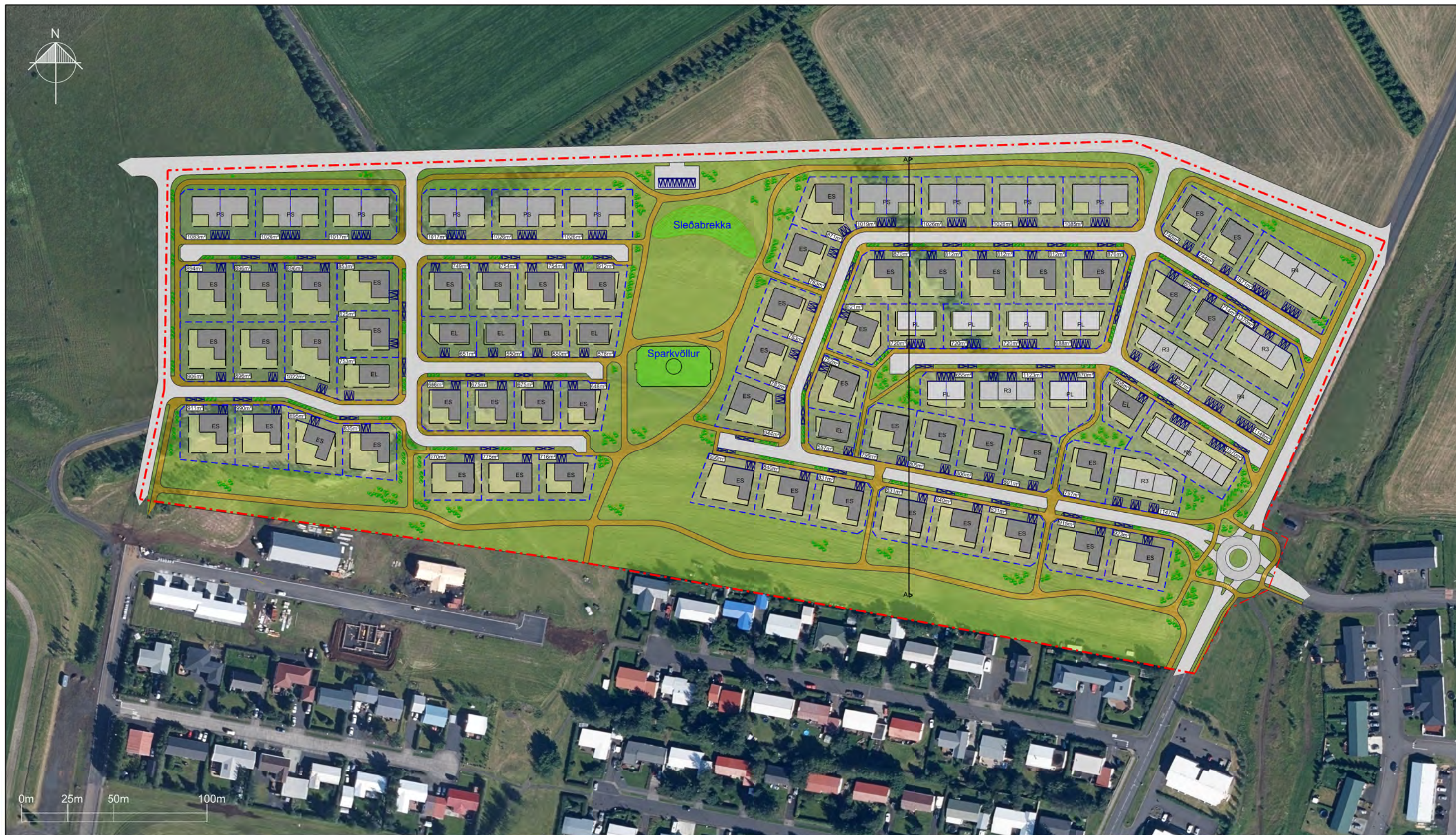
Deiliskipulagsuppráttur íbúðarbyggð og opið svæði norðan byggðar á Hvolsvelli. mkv.1:2000.