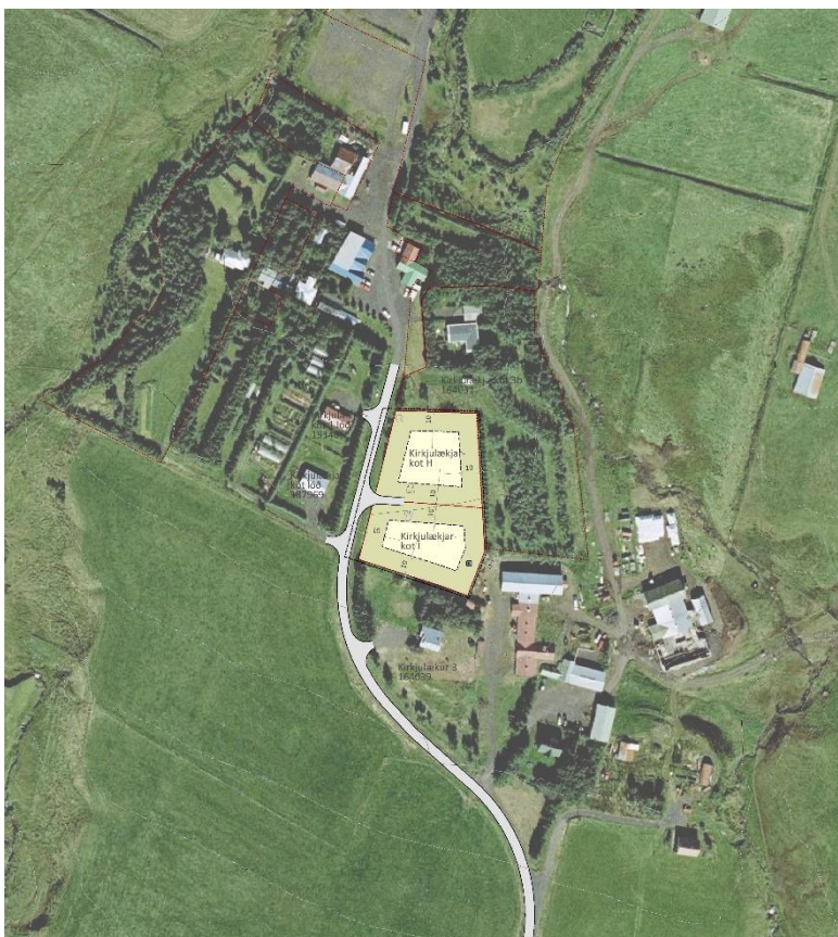
MYND 1. Yfirlitsmynd af bæjartorfu Kirkjulækjarkots. Nýju lóðirnar tvær eru á miðri mynd.

Í vistgerðarkortlagningu Náttúrufræðistofnunar er bæjartorfa Kirkjulækjarkots flokkuð sem þéttbýli og annað manngert land. Því er ekki um að ræða vistgerðir með hátt verndargildi á svæðinu.