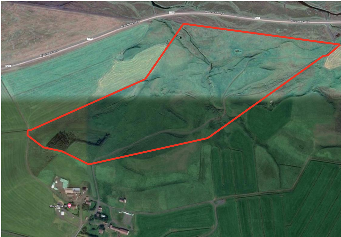
MYND 4. Skipulagssvæðið merkt með rauðu.

Skógræktar- og landgræðslusvæði er fyrirhugað úr landi Stóru-Markar 1 og 3 (L163810), mun lóðin fá nafnið Stóra-Mörk 3C og verður um 27 ha að stærð.