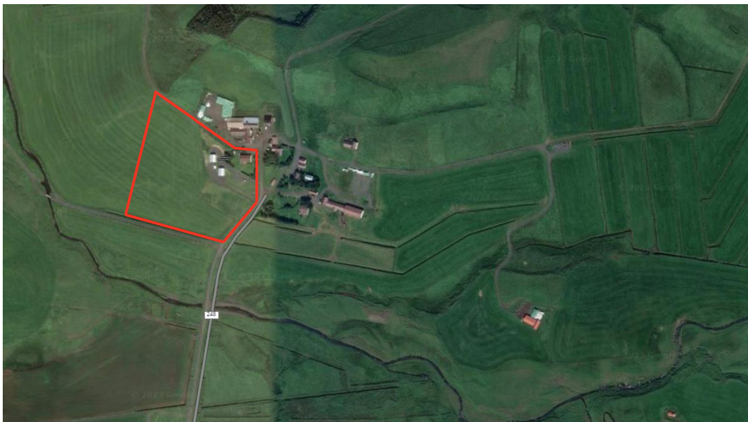
MYND 3. Skipulagssvæðið er merkt með rauðu.

Lóð úr landi Stóru-Merkur (Stóra-Mörk 3B L224421) verður stækkuð og skilgreint þar sem verslunar- og þjónustusvæði, á um 3,4 ha svæði.