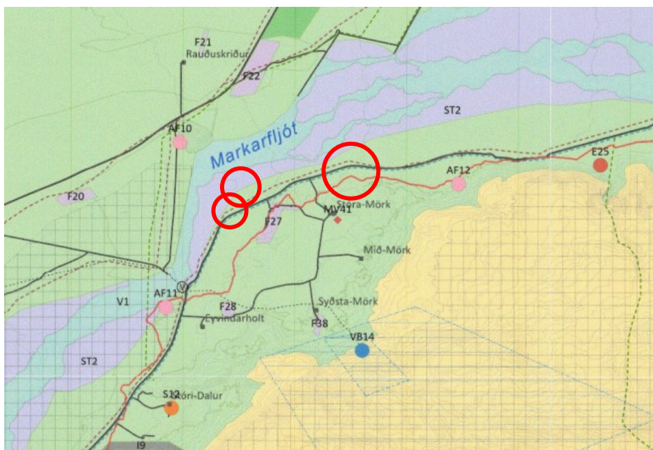
MYND 1. Hluti af Aðalskipulagi Rangárfjörðinga eystra 2020-2032. Skipulagssvæðin eru innan rauðu hringjanna.