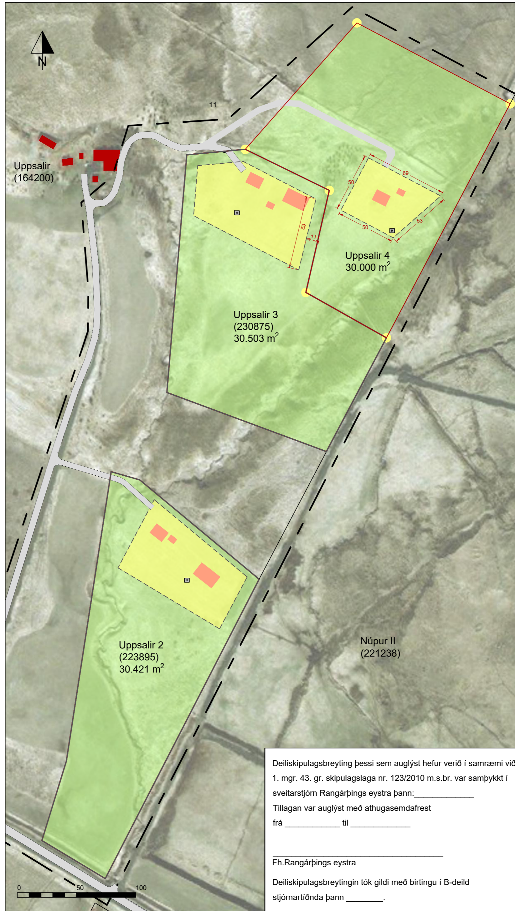
Deiliskipulag eftir breytingu mkv. 1:2000

Deiliskipulagsbreyting þessi sem auglýst hefur verið í samræmi við 1. mgr. 43. gr. skipulagslaga nr. 123/2010 m.s.br. var samþykkt í sveitarstjórn Rangárþings eystra þann: _____ Tillagan var auglýst með athugasemdafrest frá _____ til _____ _____ Fh.Rangárþings eystra Deiliskipulagsbreytingin tók gildi með birtingu í B-deild stjórnartíðnda þann _____.