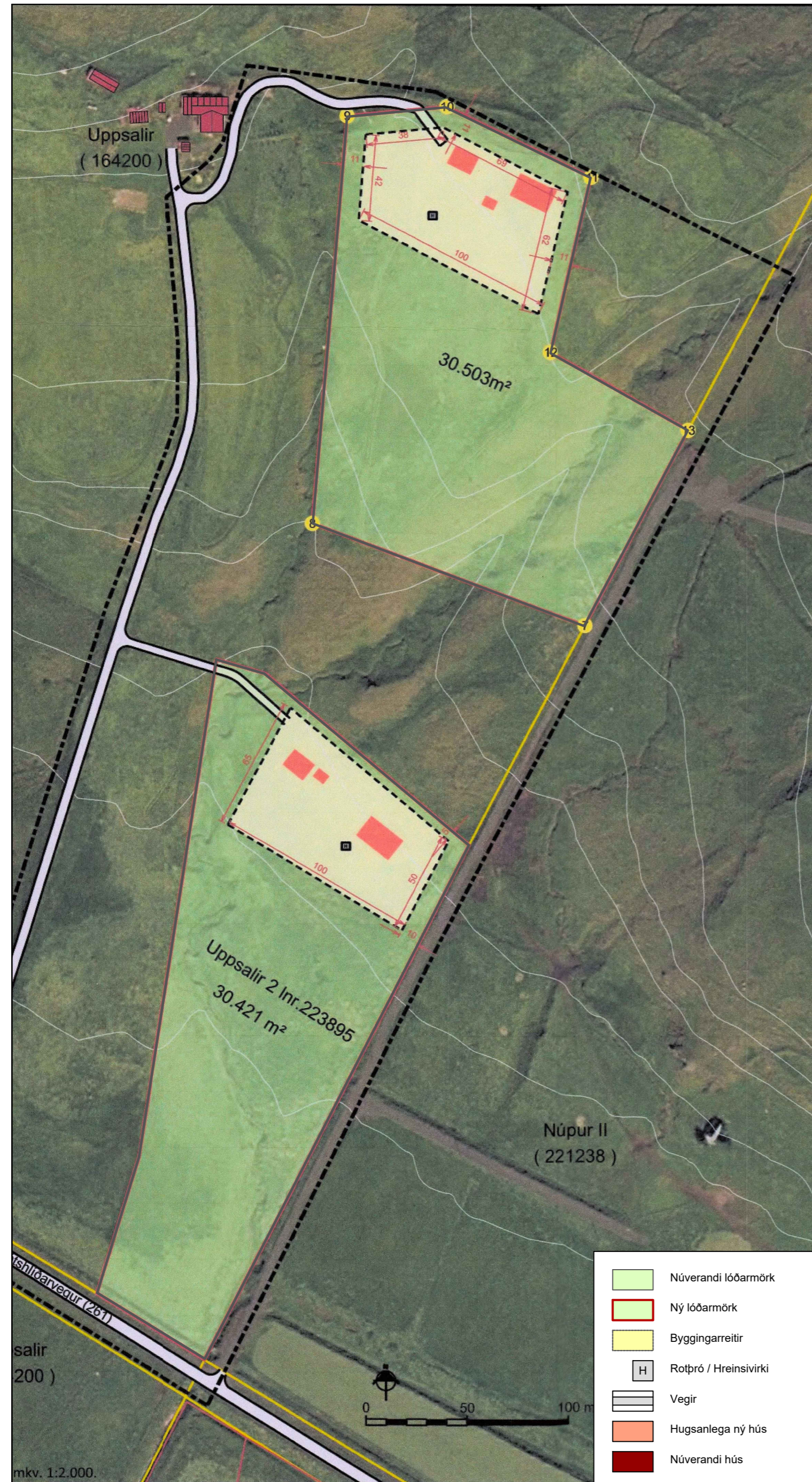
Úrklippa úr gildandi deiliskipulagi m.s.br. mkv. 1:2000