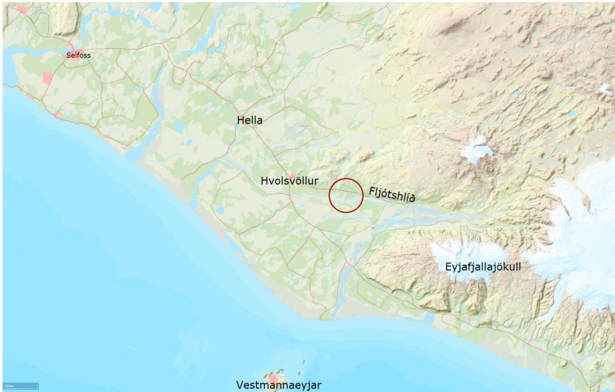
MYND 1. Yfirlitsmynd yfir suðurland. Svæðið er afmarkað með rauðum hring 1 .

Svæðið er flatlent og tvískipt gróðurlega séð. Á hluta lóðanna er trjábelti en annars er svæðið grasivaxið og gott landbúnaðarland í flokki 1.