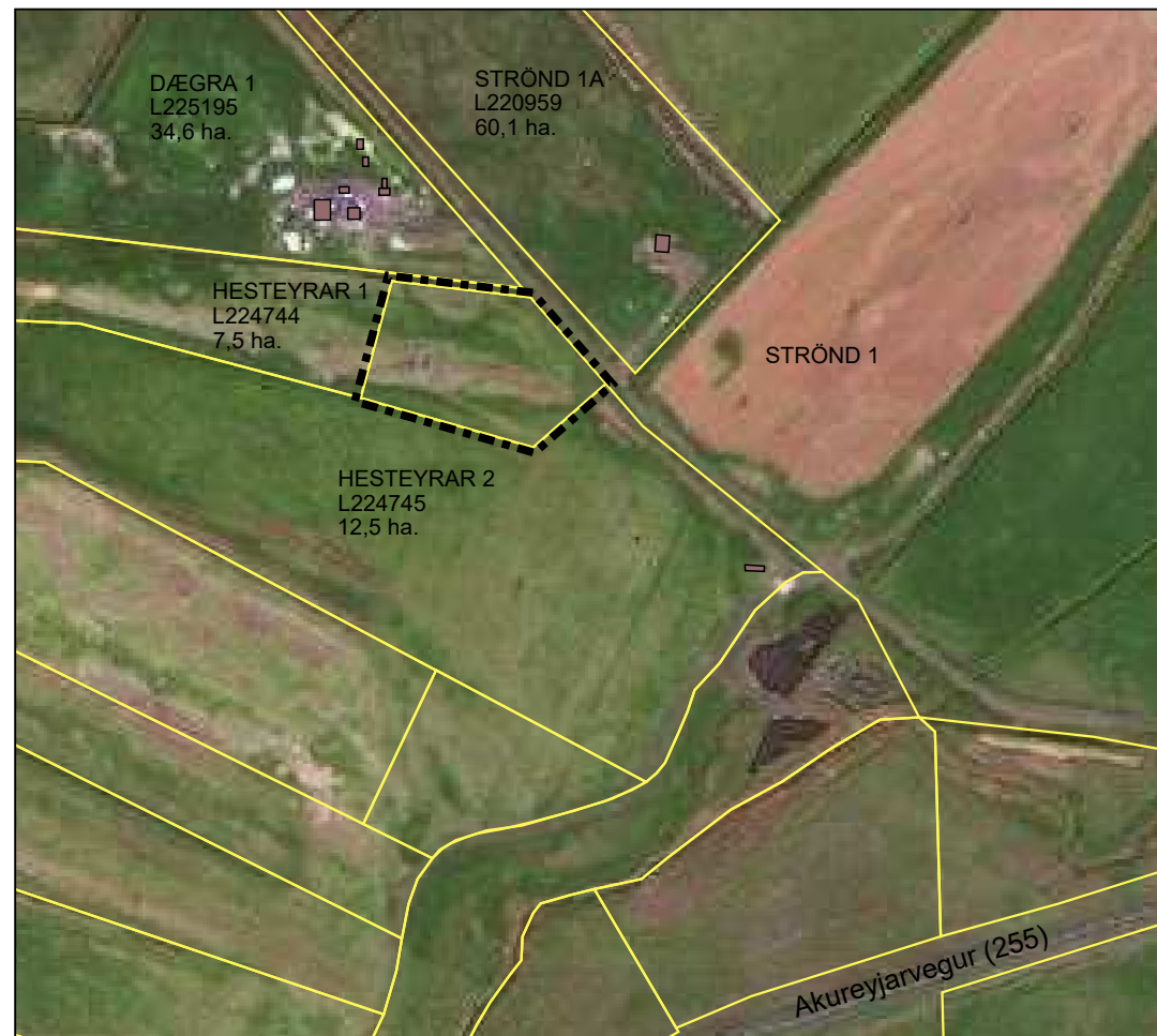
Afstöðumynd í mkv. 1 : 5.000

Leitast skal við að samræma form, efnis- og litaval húsa. Húsagerðir eru frjálssar að öðru leyti en því sem skipulagsskilmálar, mæli- og hæðarblöð, byggingareglugerð og aðrar reglugerðir segja til um.