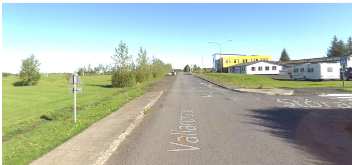
Mynd 1. Horft norður eftir Vallarbraut

Landið er að mestu flatt fyrir utan lágjar manir sem hafa verið settar til að afmarka bílastæði og íþróttavöll. Svæðið er nokkuð opið fyrir norðlægum vindum og er að finna ræktaðan trjágróður á svæðinu. Grunnskóla- og sundlaugarsvæðið er nokkuð skjólgott og gróðri vaxið.