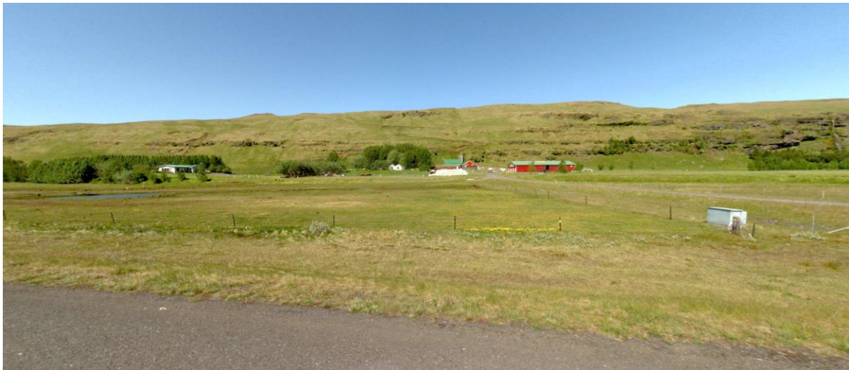
MYND 1. Horft yfir Hlíðarendakot til norðurs frá Fljótshlíðarvegi.