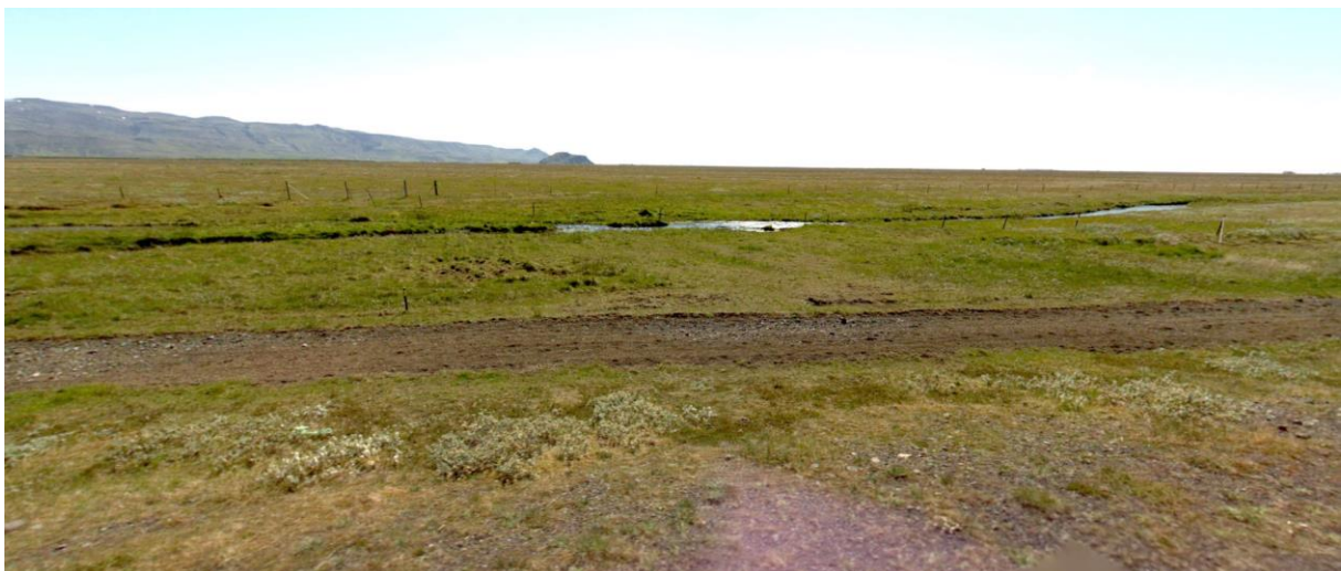
MYND 2. Horft yfir Hlíðarendakot til suðurs frá Fljótshlíðarvegi

Engar þekktar fornminjar eru á svæðunum sem tekur breytingum.