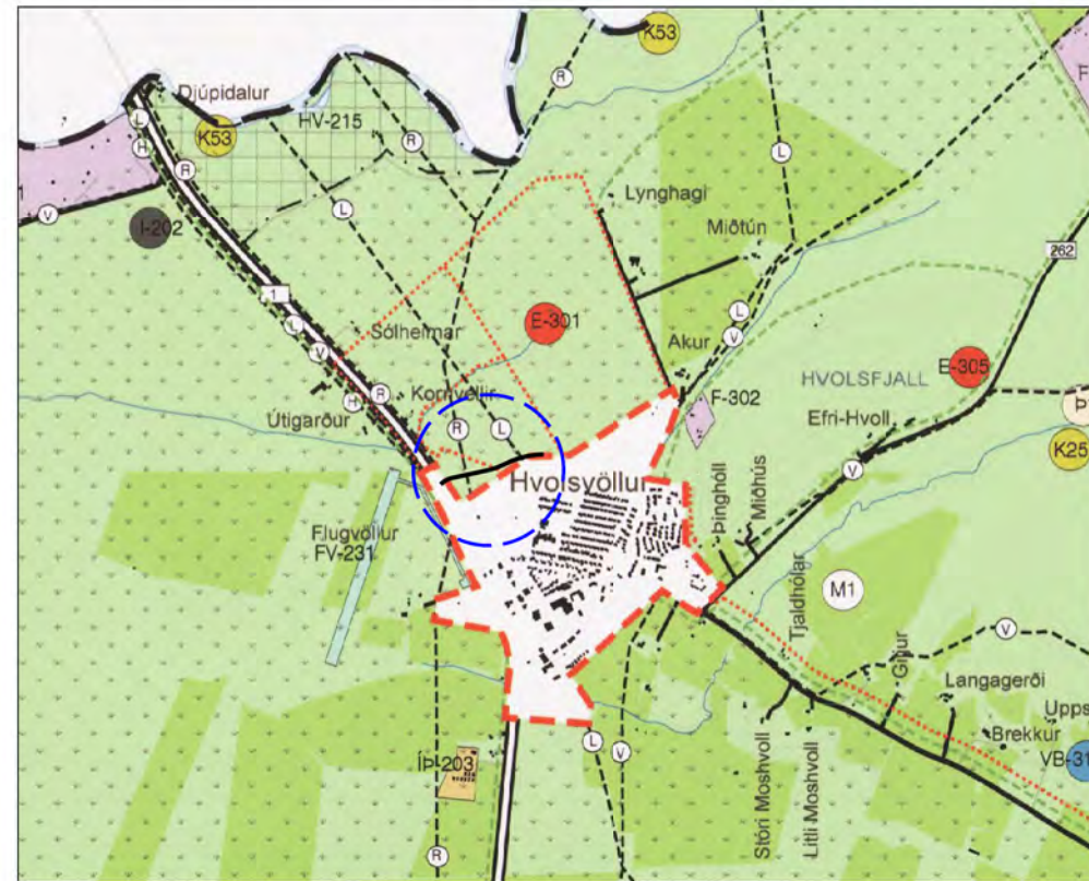
Tillaga að breytingu á aðalskipulagi (Sveitafélagsuppráttur) í mars 2021, mkv. 1:50.000