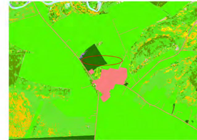
Mýnd 1. Vistgerðarkort Náttúrufræðistofnunar Íslands.