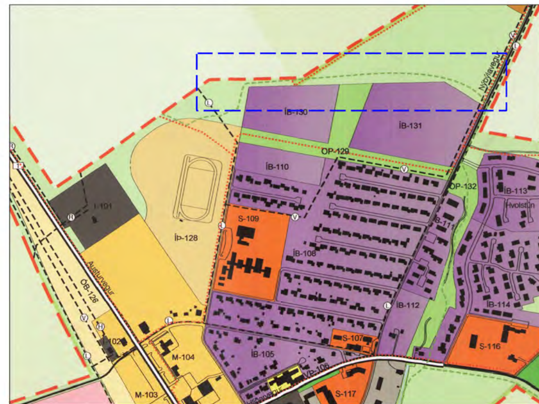
Gildandi aðalskipulag (Þéttbýlisuppráttur) frá maí 2015, mkv. 1:10.000