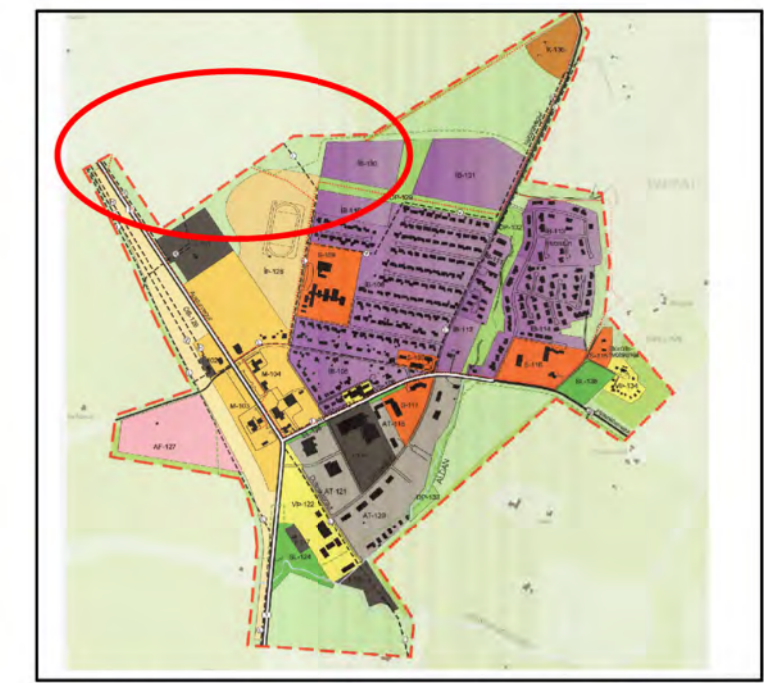
Hluti Sveitarfélagsuppráttar Aðalskipulag Rangárþings eystra 2012-2024. Skipulagssvæðið merkt rauðum hring.