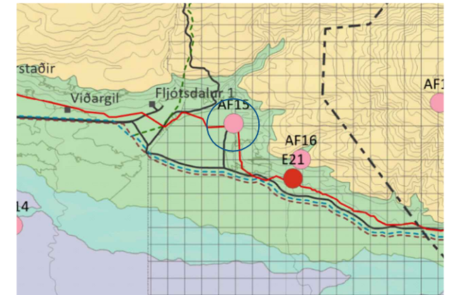
AÐALSKIPULAG RANGÁRÞINGS EYSTRA 2020-2032

Deiliskipulagsuppdráttur Greinagerð með forsendum og umhverfismatsskýrslu KORTAGRUNNUR Skipulagsuppdráttur er teiknað í kortagrunni sveitarfélagsins.