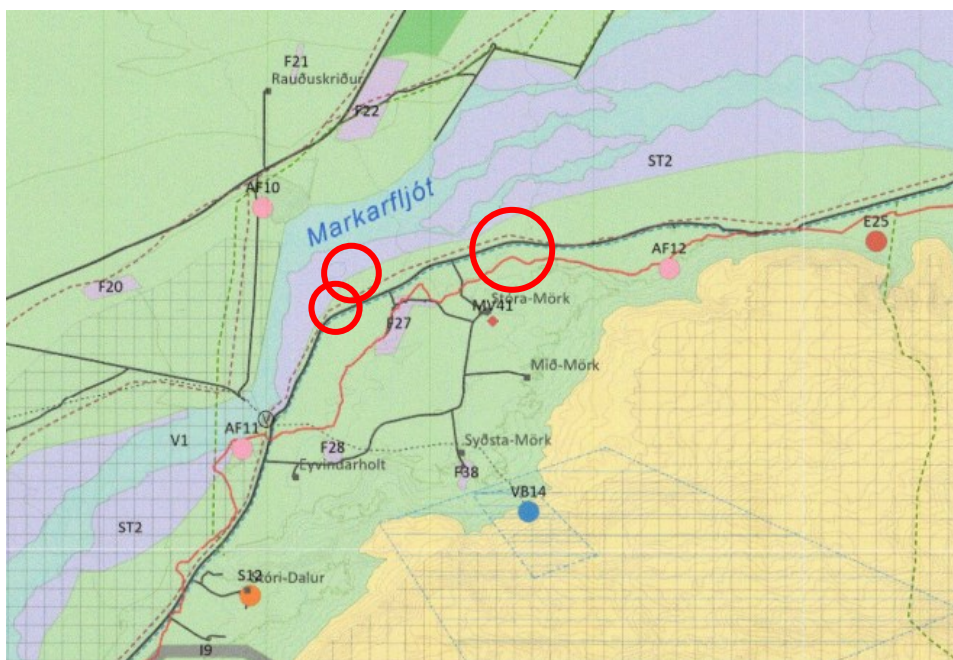
MYND 1. Hluti af Aðalskipulagi Rangárþings eystra 2020-2032. Skipulagssvæðin eru innan rauðu hringjanna.