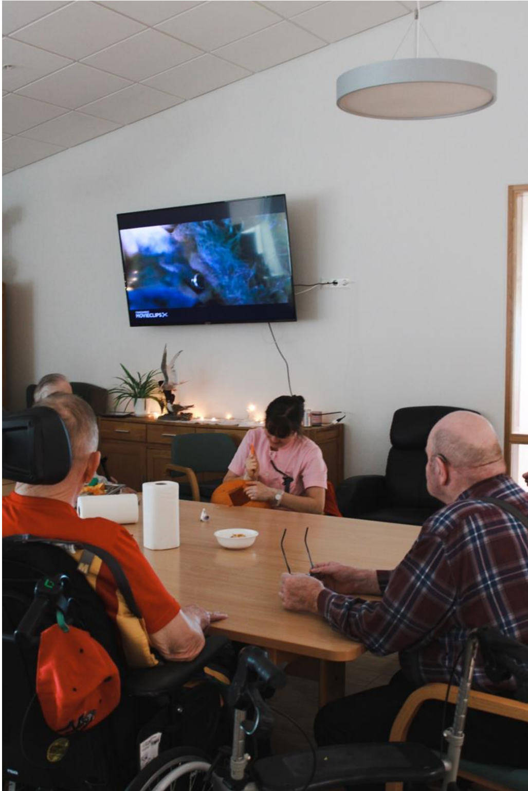
Mikill metnaður við störf