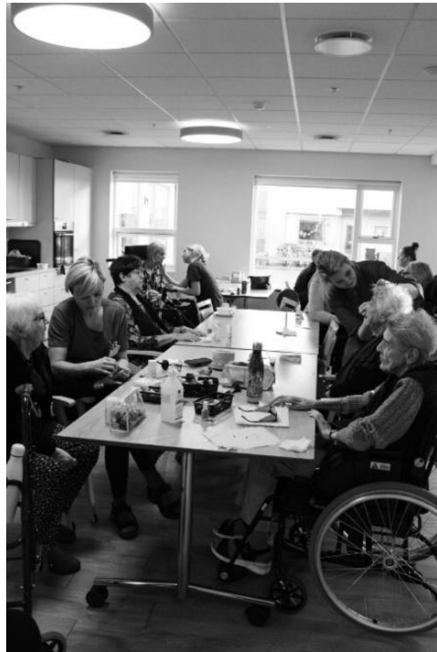
Allir í dekri