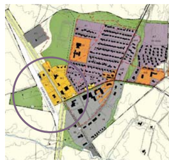
Úr Aðalskipulagi Rangárfings eystra 2003-2015