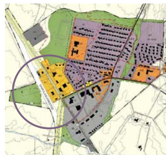
Úr Aðalskipulagi Rangárþings eystra 2003-2015